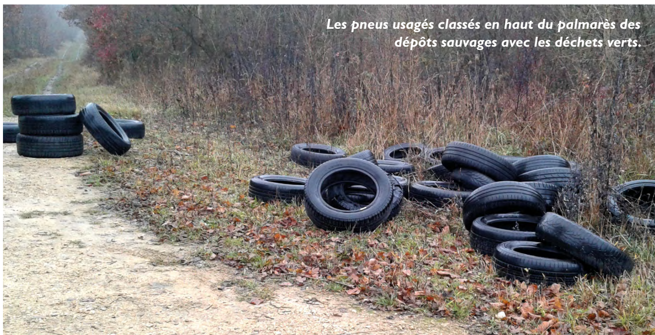
Les pneus usagés classés en haut du palmarès des dépôts sauvages avec les déchets verts.

Les dépôts sauvages en forêt de Haye, on n'aime pas vraiment, l'Office national des forêts non plus. Il aime d'autant moins qu'il devra prendre le temps de les enlever, de les traiter ou de les apporter en déchetterie et, pire, solliciter une entreprise spécialisée qui lui facturera l'enlèvement de ceux apparentés à l'amiante.