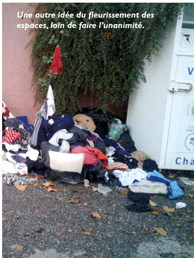
Une autre idée du fleurissement des espaces, loin de faire l'unanimité.