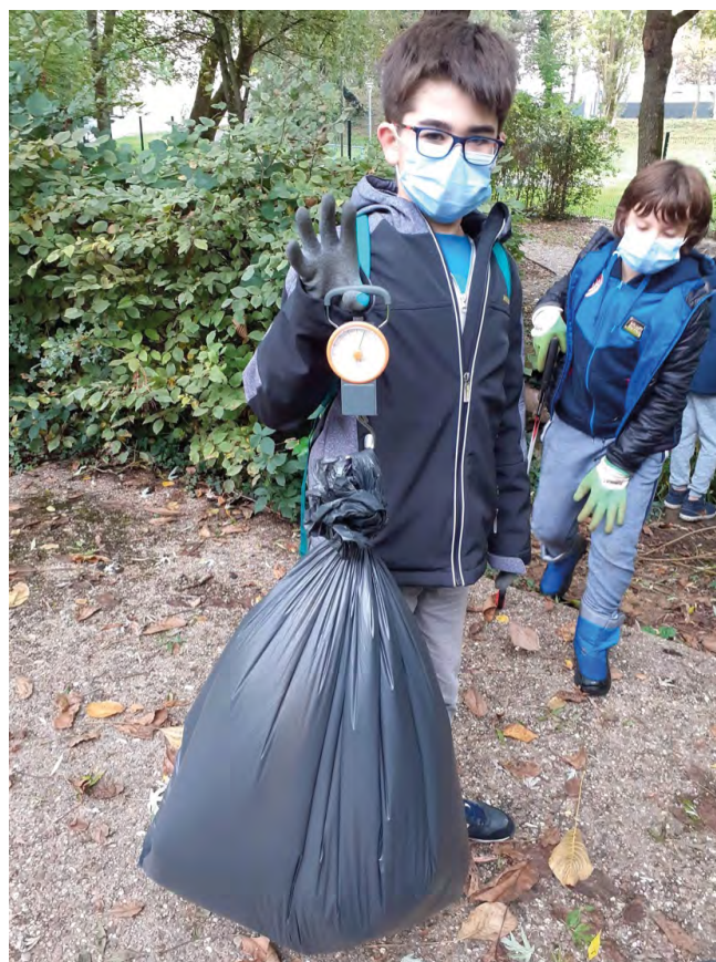
Près de 8 kg de déchets ramassés sur une portion de la coulée verte dans le cadre de la fête de la nature : le conseil municipal d'enfants a déjà retroussé les manches au profit de notre environnement.

Concernant les bâtiments communaux, le boulodrome, le stade Roger Bambuck et le centre technique vont être équipés de vidéosurveillance. Il s'agit prioritairement de protéger nos biens, donc les biens des Villarois, déjà cambriolés.