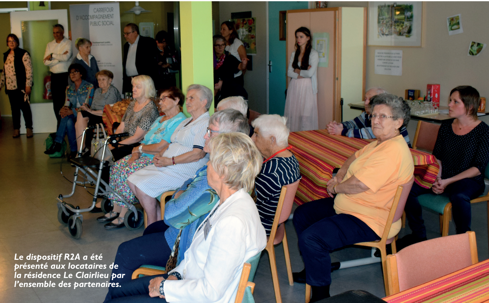
Le dispositif R2A a été présenté aux locataires de la résidence Le Clairlieu par l'ensemble des partenaires.

Il ne s'agit pas d'un robot tout droit sorti d'un film de science-fiction mais d'un projet piloté par le réseau gérontologique Gérard Cuny et par le CPN (centre psychothérapeutique de Nancy) et porté par le CAPS (carrefour d'accompagnement public social) en lien avec un réseau de partenaires, parmi lesquels la commune joue un rôle important puisqu'elle a choisi d'accueillir ce dispositif au sein de la résidence Le Clairlieu .