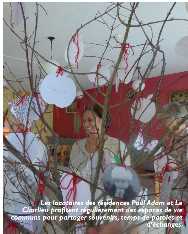
Les locataires des résidences Paul Adam et Le Clairlieu profitent régulièrement des espaces de vie communs pour partager souvenirs, temps de paroles et d'échanges.

Mais la phase préalable est le recueil des besoins des habitants d'aujourd'hui : une phase d'étude et de concertation vient de débuter avec les résidents et se poursuivra tout au long de l'année. À noter qu'un logement témoin sera aménagé pour leur permettre de tester les installations et de livrer leurs retours d'expérience. Un partenariat avec le Centich a été signé en ce sens (voir ci-après l'interview de Patrick Favre).