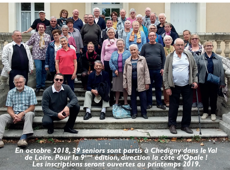
En octobre 2018, 39 seniors sont partis à Chedigny dans le Val de Loire. Pour la 9 ème édition, direction la côte d'Opale ! Les inscriptions seront ouvertes au printemps 2019.