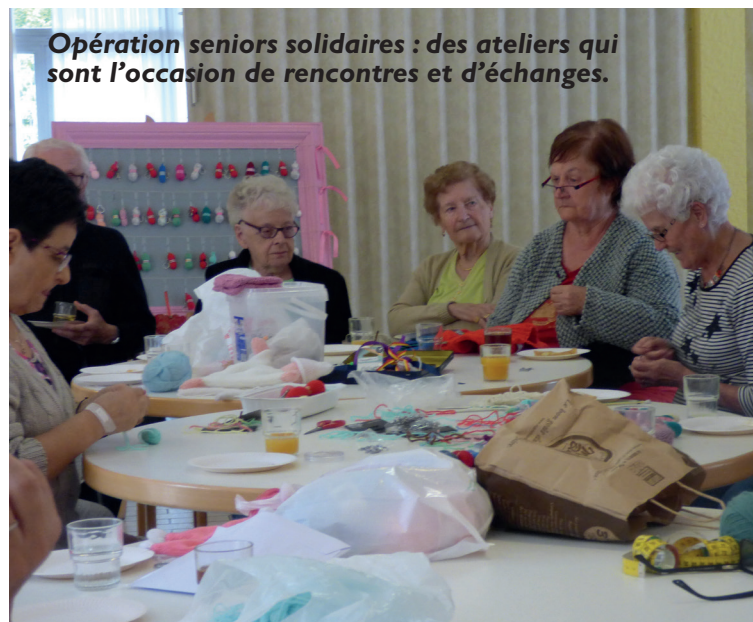
Opération seniors solidaires : des ateliers qui sont l'occasion de rencontres et d'échanges.

Vous pouvez les contacter au 06 14 68 49 90.