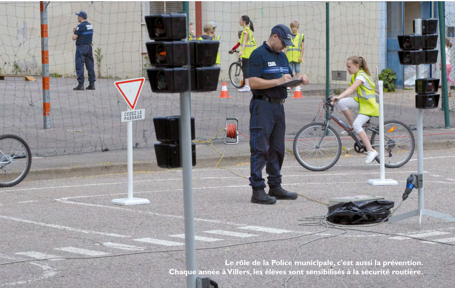
Le rôle de la Police municipale, c'est aussi la prévention. Chaque année à Villers, les élèves sont sensibilisés à la sécurité routière.