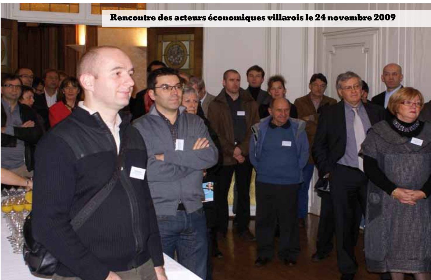
Rencontre des acteurs économiques villarois le 24 novembre 2009

Par ailleurs, la municipalité enverra en début d'année un questionnaire sur les jobs d'été, avec la volonté, à travers l'envoi de ce questionnaire, de faciliter la liaison entre l'offre et la demande. De nombreux jeunes Villarois recherchent en effet tous les ans des stages ou des jobs d'été.