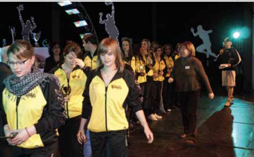
Remise du prix de l'équipe de l'année aux filles du Cos Rugby

Voici le palmarès 2009 des trophées des sports :