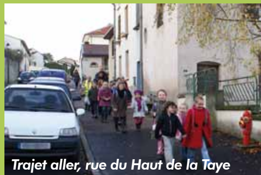
Trajet aller, rue du Haut de la Taye

Le Pédibus change de nom, les enfants du Conseil municipal d'enfants se sont penchés sur la question.