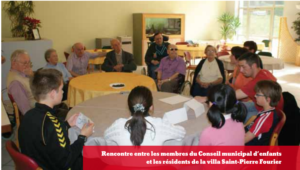
Rencontre entre les membres du Conseil municipal d'enfants et les résidents de la villa Saint-Pierre Fourier

Vous pouvez aussi apporter votre témoignage ou nous confier certaines anecdotes sur la vie quotidienne au fil du temps à Villers au cours d'un entretien individuel : il vous suffit de contacter directement Sandrine Bronner au 06 68 54 67 20 pour fixer un rendez-vous.