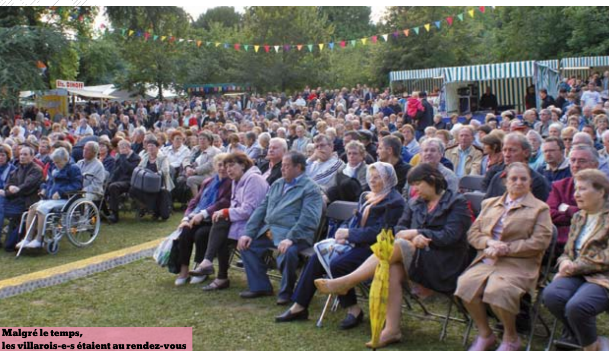
Malgré le temps, les villarois-e-s étaient au rendez-vous