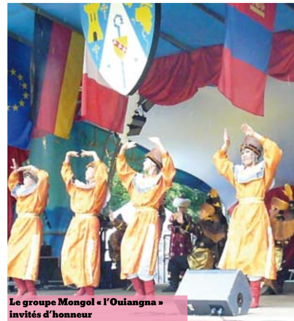
Le groupe Mongol « l'Ouiangna » invités d'honneur