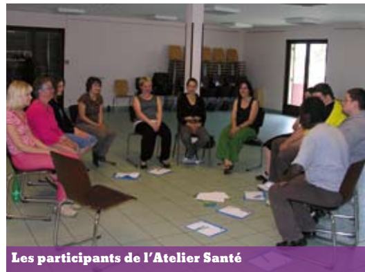
Les participants de l'Atelier Santé

Depuis le début de l'année 2008, l'équipe du Pôle emploi a mis en place deux ateliers thématiques, l'un sur la culture, l'autre sur la santé, avec pour chacun, plusieurs objectifs : tout d'abord, apporter aux participants des informations et des connaissances dans des domaines qu'ils ne maîtrisaient pas forcément ; puis, rompre la solitude et l'isolement consécutifs à l'exclusion professionnelle ; enfin, travailler sur la confiance en soi et la revalorisation de son image personnelle.