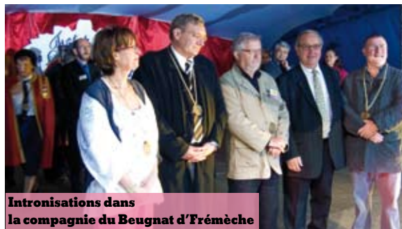
Intronisations dans la compagnie du Beugnat d'Frémèche