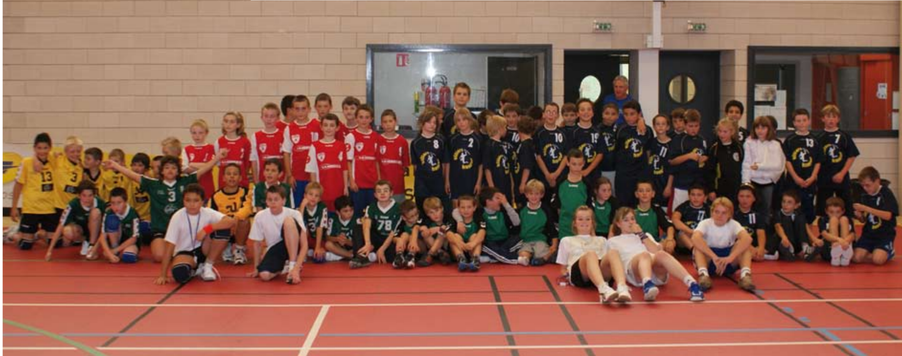
Journée nationale de l'arbitrage