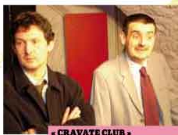
« CRAVATE CLUB »