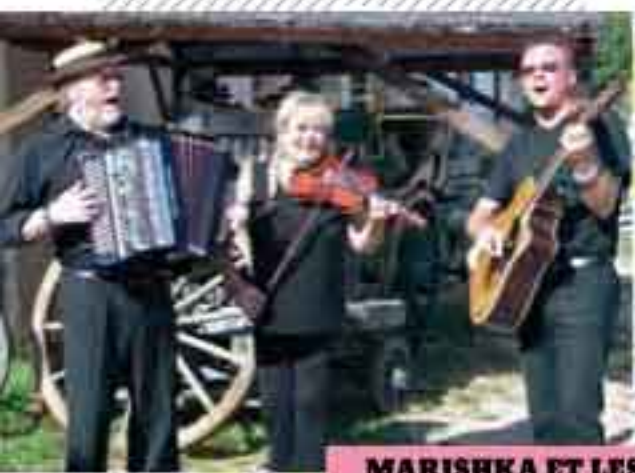
MARISHKA ET LES « R'JOYEUX »