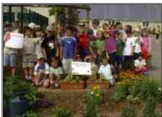
Les élèves des écoles maternelle et primaire des Aiguillettes avec leurs diplômes du concours départemental des écoles fleuries