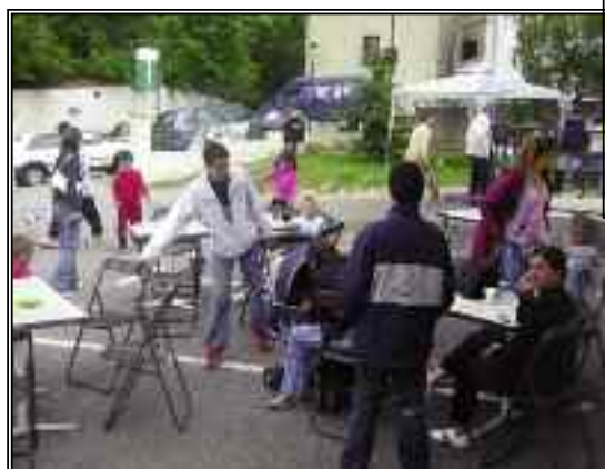
Les portes ouvertes au Pôle Actions Jeunesse