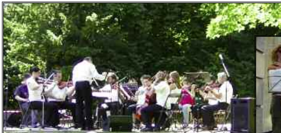
Concert de fin d'année de l'APM