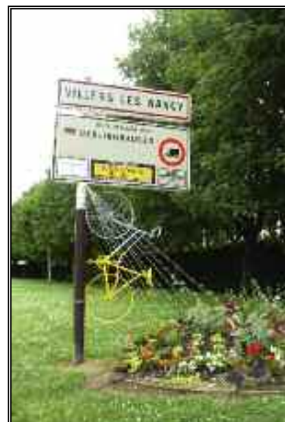
Pour le passage du Tour...