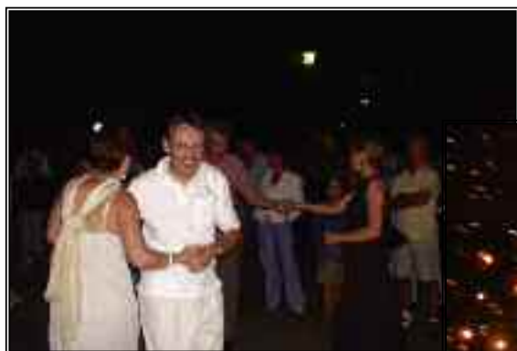
Bal et feux d'artifice du 14 juillet