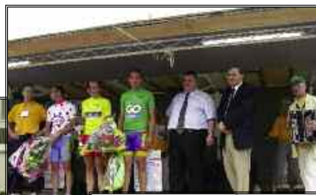
Le pré-tour 54