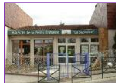
La maison de la petite enfance La Sapinière