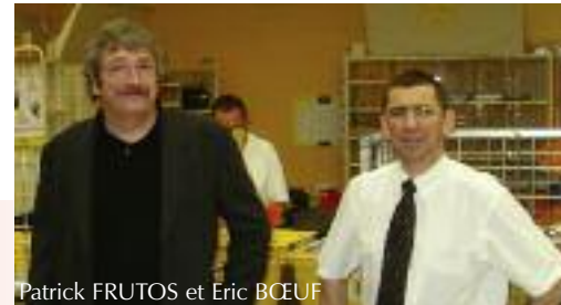
La poste de Villers-lès-Nancy, c'est 2 directions :

Ses premières impressions sur Villers-lès-Nancy sont très positives : « les gens sont sympathiques, j'ai été très bien accueilli par tous ceux que j'ai rencontrés, qu'ils soient de la Mairie, de la police municipale, des chefs d'entreprises ou le grand public ». Et il ajoute qu'il a trouvé un rythme de vie qui lui convient : « à Villers-lès-Nancy ça bouge, mais c'est calme ». Tout pour préparer sereinement ses prochains défis !