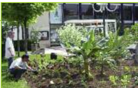
Les services techniques en action