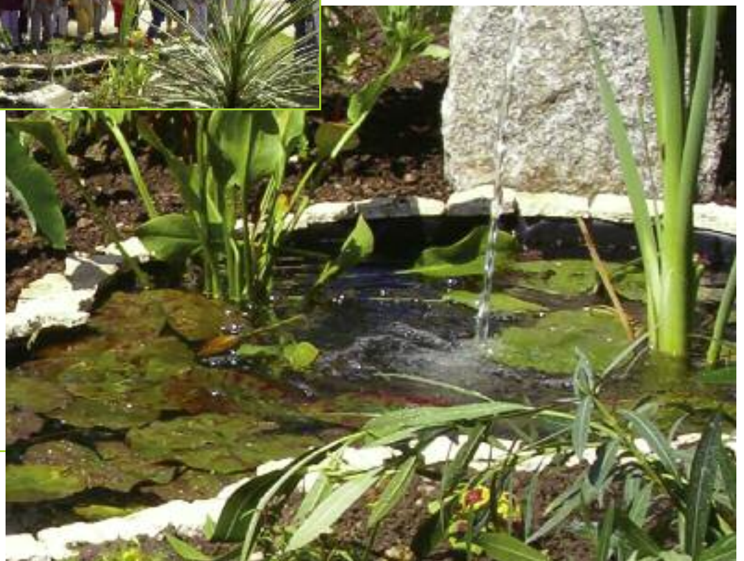
Les nénuphars du bassin de l'hôtel de ville