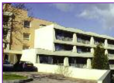
Le foyer-logement Paul Adam