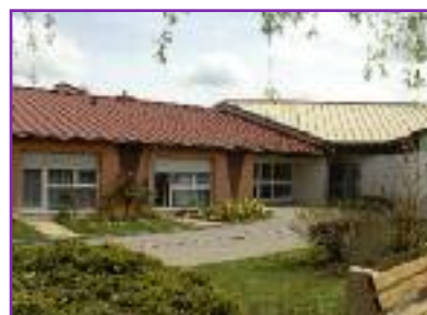
Le foyer-logement le Clairlieu