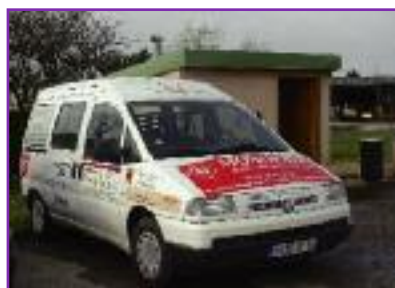
Le minibus de la Ville