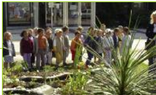
Visite de l'école maternelle des Aiguillettes

Depuis le 17 mai, les services techniques s'activent pour la création des parterres de la ville. Cette année, la Mairie a choisi le thème de l'eau avec la mise en place d'un petit bassin devant l'hôtel de ville et sur le massif à l'angle du boulevard des Aiguillettes et de l'avenue Paul Muller. Les végétaux utilisés sont des plantes aquatiques, semi-aquatiques et de milieu humide.