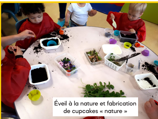
Éveil à la nature et fabrication de cupcakes « nature »