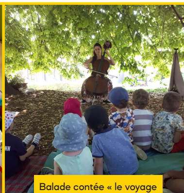
Balade contée « le voyage de l'escargot » à Graffigny