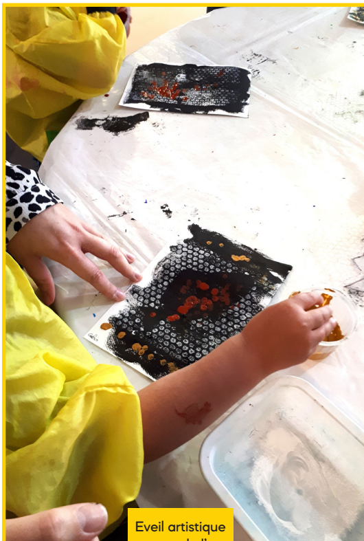
Éveil artistique autour de l'art aborigène