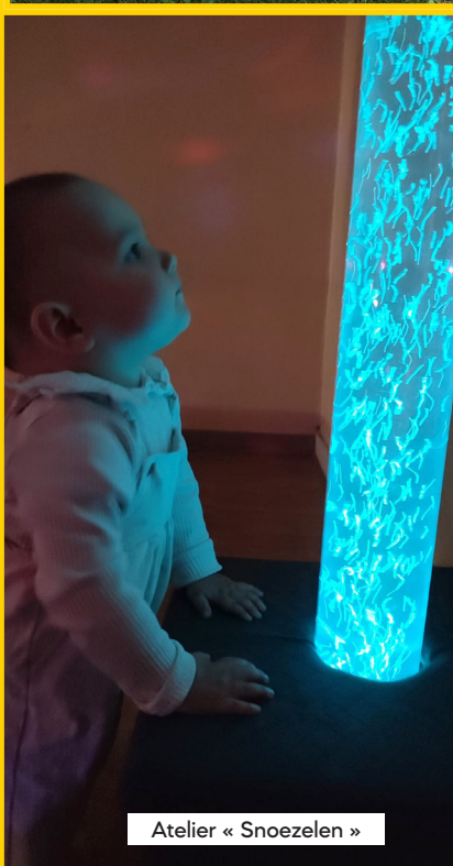
Atelier « Snoezelen »